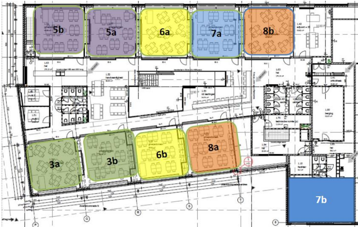
Bovenverdieping De Reijer 2022-2023